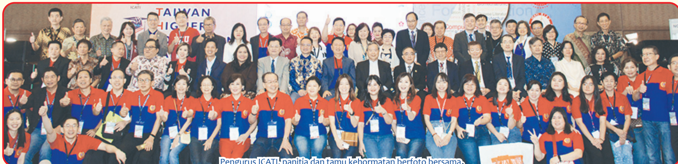
Pengurus ICATI, panitia dan tamu kehormatan berfoto bersama.