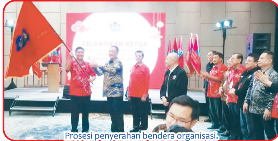
Prosesi penyerahan bendera organisasi.

Dia pun mengajak anggota PSMTI Jateng untuk berpegangan tangan membesarkan nama PSMTI Jateng agar dapat dikenal oleh masyarakat.