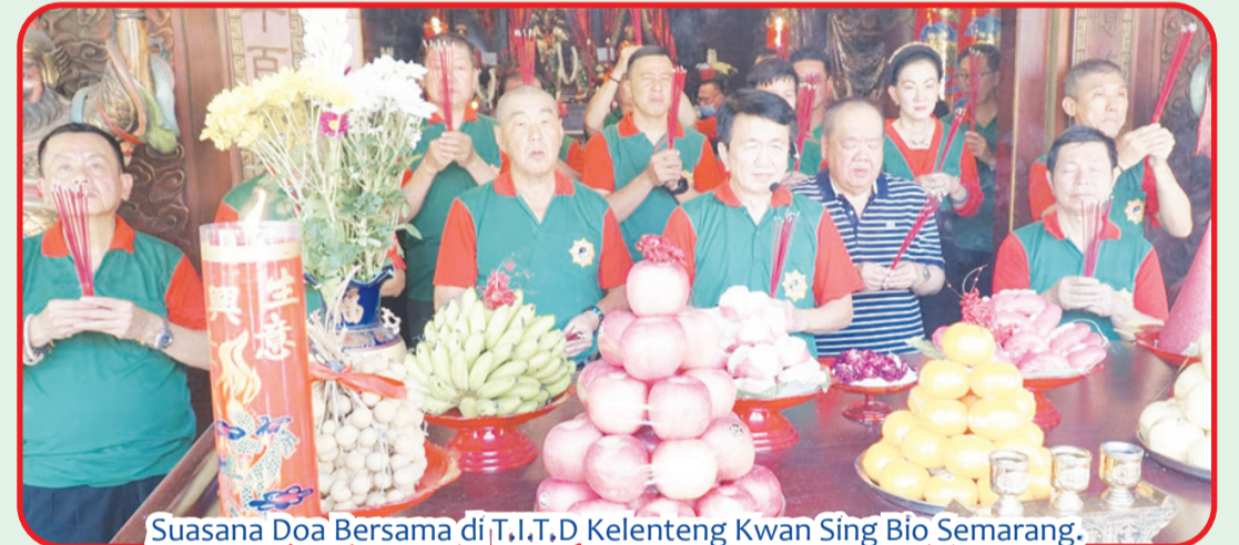
Suasana Doa Bersama di T.I.T.D Kelenteng Kwan Sing Bio Semarang.

SEMARANG (IM) - Dalam rangka Sejit YM Namu Cia Lan Phu Sa, T.I.T.D Kelenteng Kwan Sing Bio, Jalan Tanggul Mas Raya No.9 (Tanah Mas) Semarang, Jawa Tengah mengadakan Doa Bersama pada Kamis (10/8) siang.