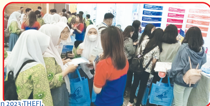
Para pengunjung antusias mengunjungi pameran pendidikan 2023 THEFI.