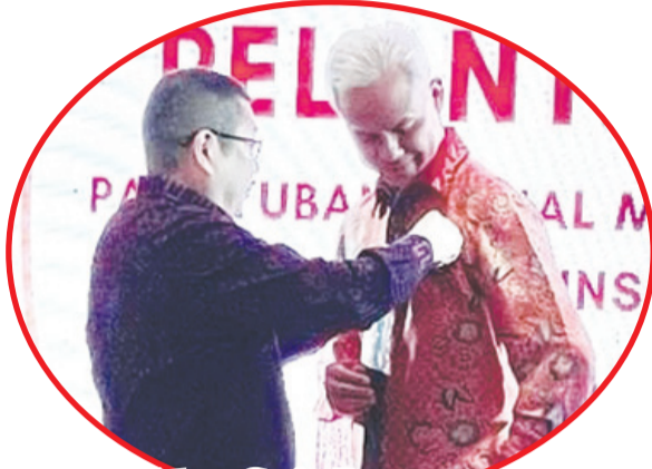
Gubernur Jateng Ganjar Pranowo menerima pin PSMTI.

Bambang menyampaikan terima kasih atas kepercayaan yang diberikan ini.