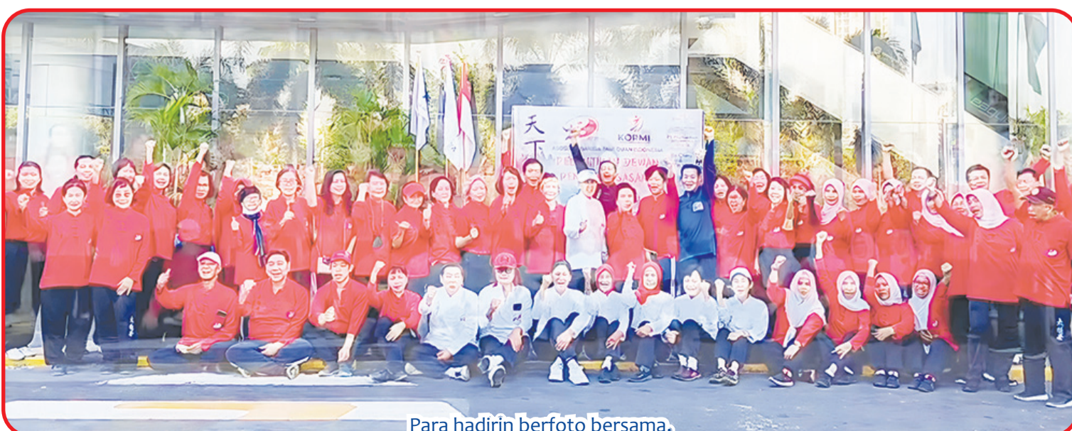
Para hadirin berfoto bersama.