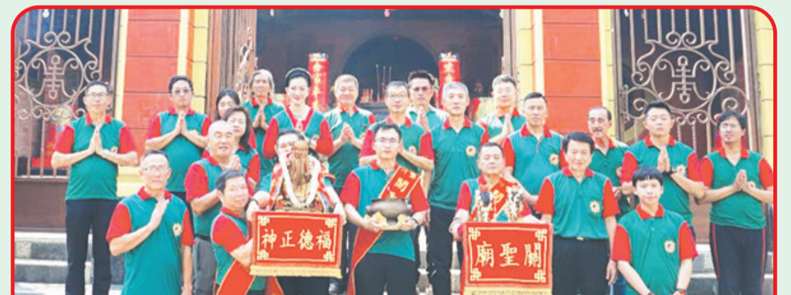
Pengurus Yayasan Tri Setia Bakti Semarang berfoto bersama umat dan simpatisan, sebelum Kimsien YM Hok Tek Tjing Sien di berangkatkan duduk kembali ke Altar Hok Siu Bio.